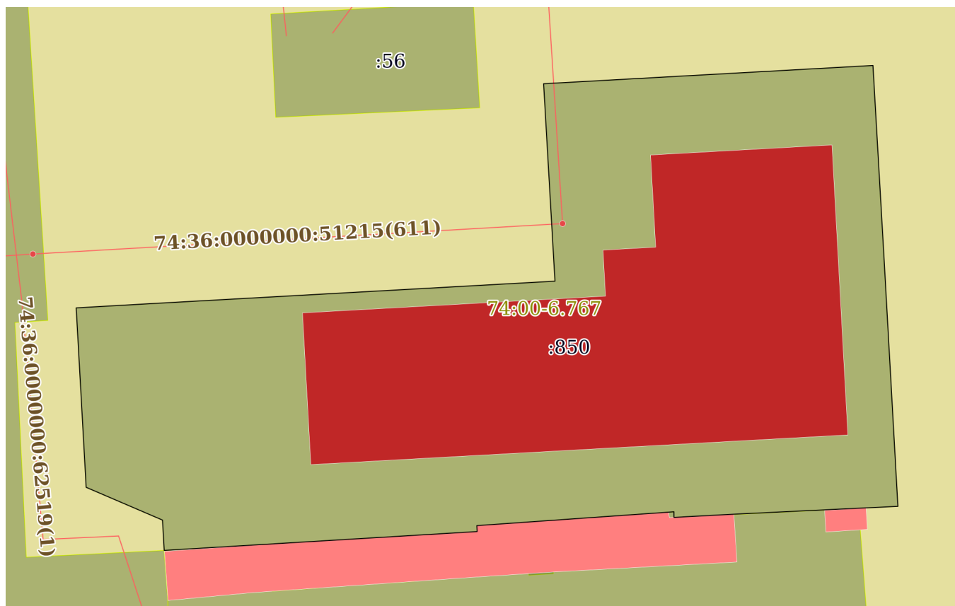
План (чертеж, схема) земельного участка